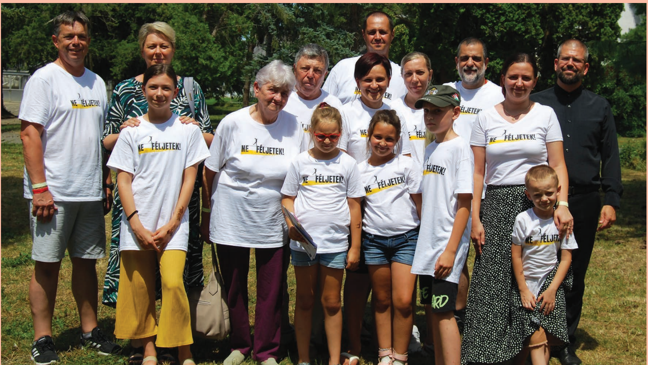
Viski testvérgyülekezetünk tagjaival a Mécsestartók idei táborában

Köszönjük, ha a fentebb felsorolt célokra és gyülekezetünk állandó kiadásaira adakozik! Istené legyen érte a hála!